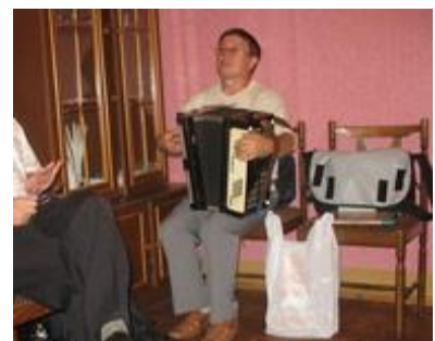
гармонь (accordion) гармоньчо гармоньым шокташ (-ем)