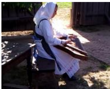
кўсле (gusli) кўслезе кўслем шокташ (-ем)

Familiarize yourself with the following musical instruments, the terms used for the person that plays said instrument, and the verbs used for playing said instruments.