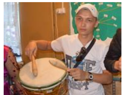
тўмыр (drum) тўмырзё тўмырым пераш (-ем)