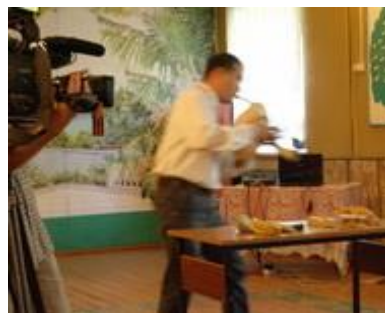
шўвыр (bagpipes) шўвырзё шўвырым шокташ (-ем)