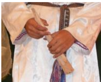
шиялтыш (pipe, fife) шиялтышче шиялтышым шокташ (-ем)