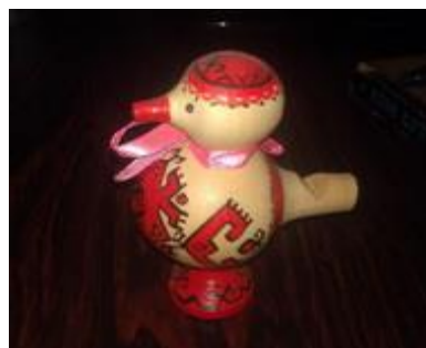
шўшпык (whistle) шўшпык дене шўшкышё шўшпык дене шўшкаш (-ем)